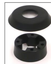
Art nr: 448714