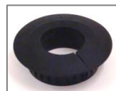
Art nr: 448708